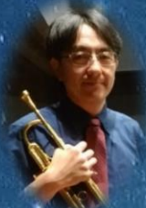
野館 PTA 会長