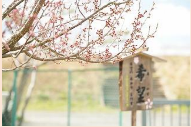
【南門にあるタカトオコヒガンザクラ～希望～】