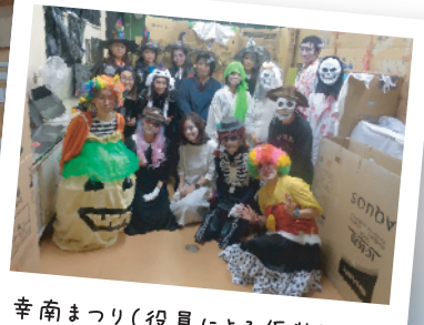
幸南まつり(役員による仮装)