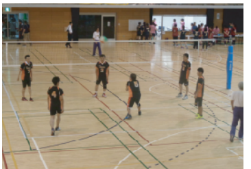
バレーボール大会