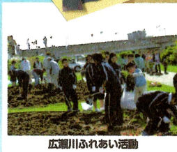
広瀬川ふれあい活動